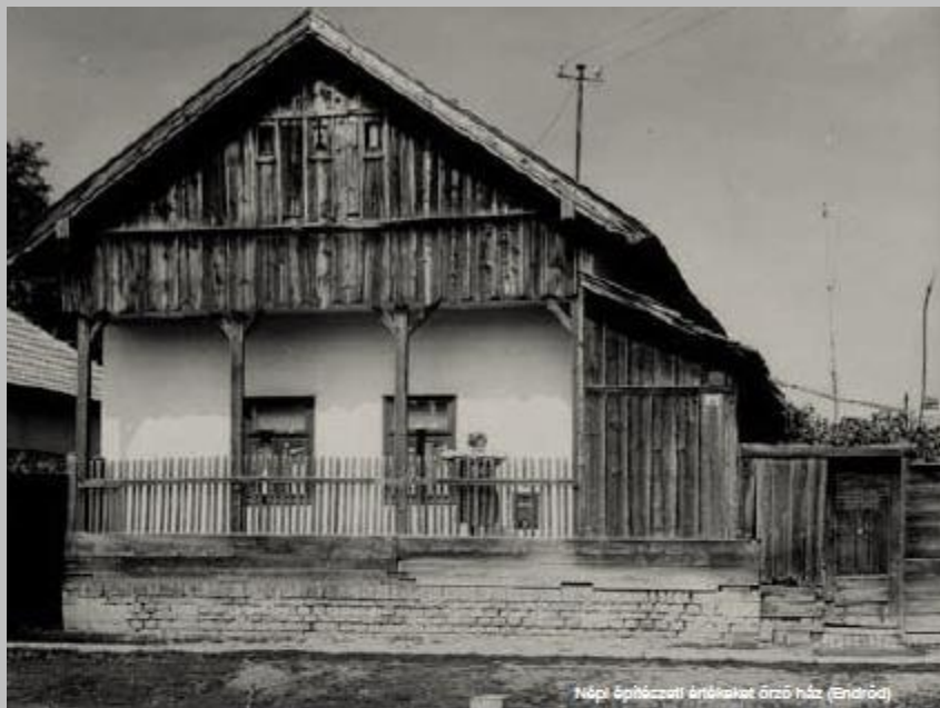
Népi építészeti értékeket őrző ház (Endrőd)